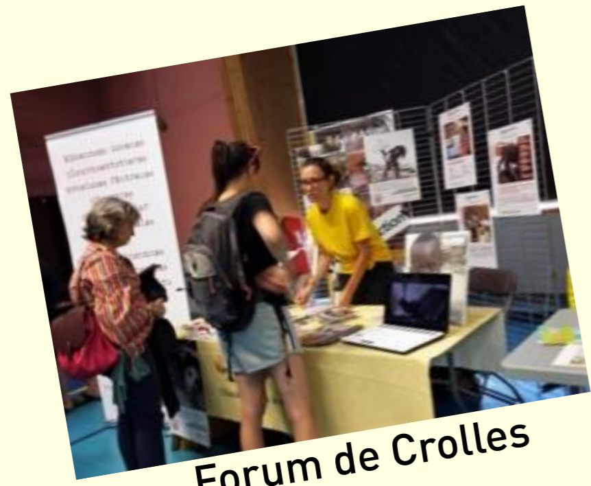
Forum de Crolles