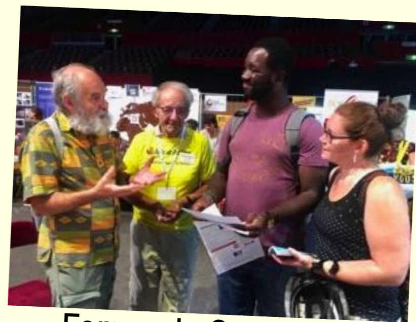
Forum de Grenoble