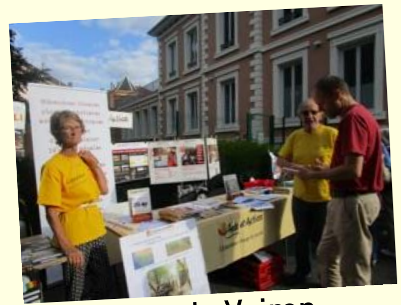
Forum de Voiron