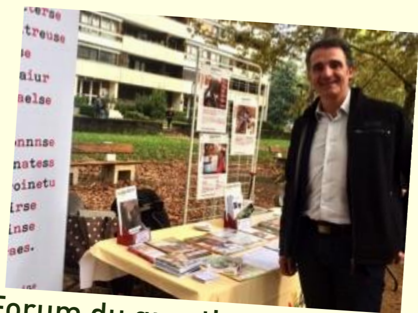
Forum du quartier Malherbe