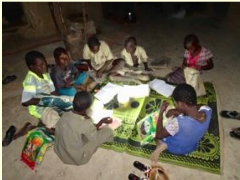
Les devoirs le soir

En 2019, dans la région des Savanes, au nord du Togo, électrification de l'école de Nagbati et de deux autres écoles : Gniboutibou et Nandobi