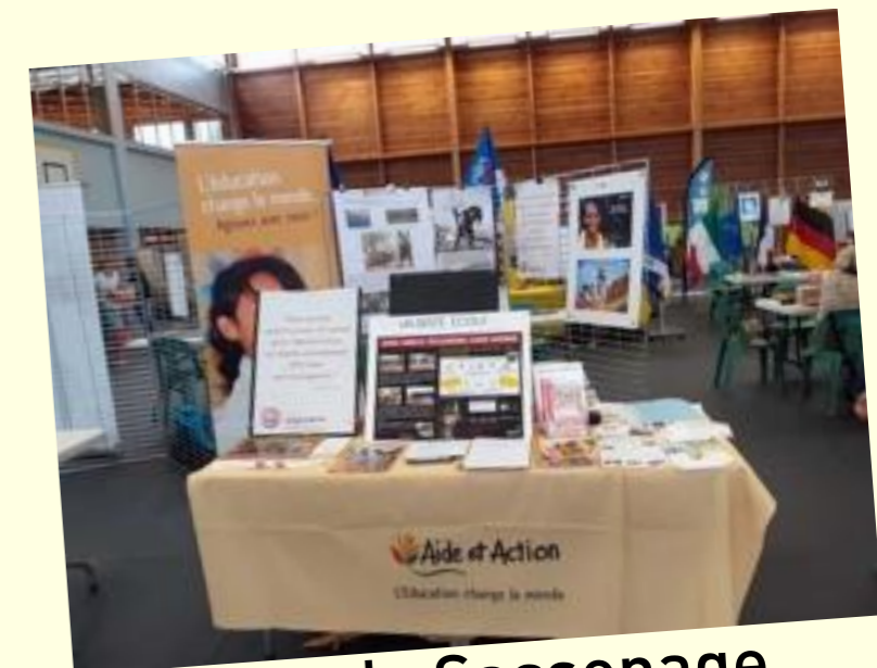
Forum de Sassenage

Plusieurs participations à différents forums sont prévues également en 2020