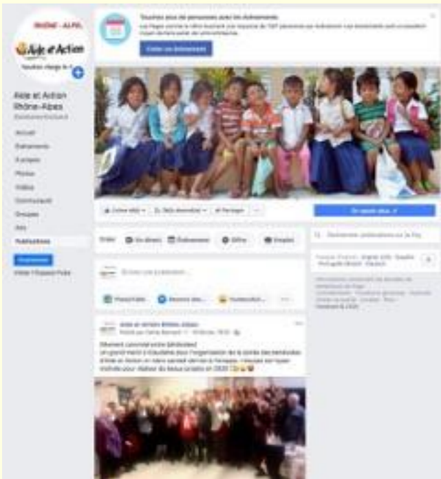
La page Facebook