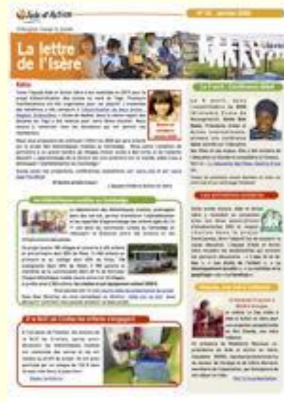
La lettre de l'Isère